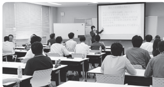
令和5年度マネジメント研修