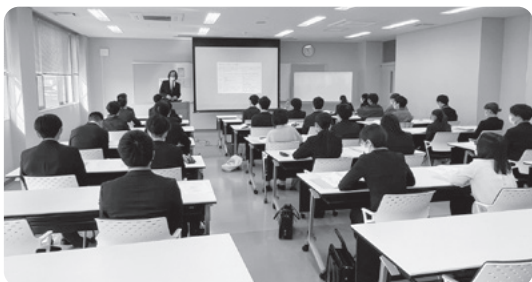
令和5年度新入社員研修

* 岡山県職業能力開発協会の会員を対象に実施します。受講定員(30名)に満たない場合は、非会員であっても受講できます。