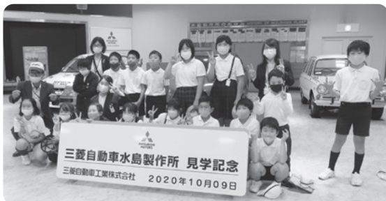
三菱自動車工業株式会社 2020年10月09日

小学校の児童を対象に、ものづくりマイスターが勤務する三菱自動車工業(株)水島製作所で「ものづくり事業所見学」を実施し、児童は、マイスターから直接話を聴くとともに工場見学を行い、ものづくり現場で大切なこと等を学習しました。