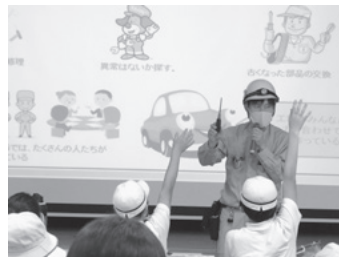
機械保全職種の講義